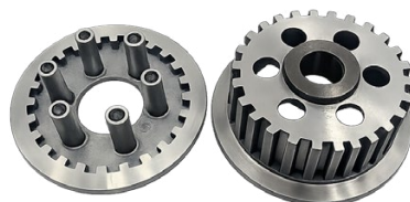
2409-1016 PION DISCOS EMBRAGUE VENTO NITROX 300 T3 (INCLUYE PRENSA DIS)