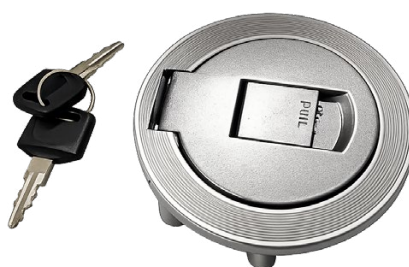
4408-1033 TAPON GASOLINA PROMOTO VENTO NITROX 300 T3