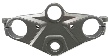
1104-1016 BASE MANUBRIO PROMOTO VENTO NITROX 300 T3